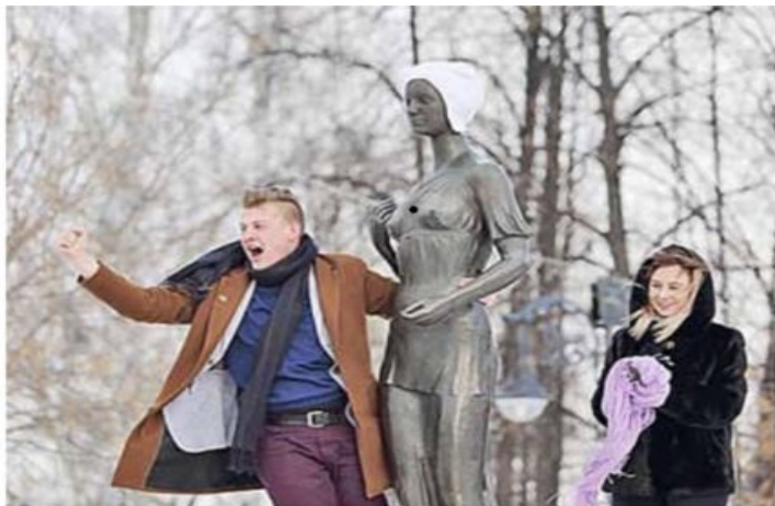
Каждый год изящную статую святой Татьяны студенты утепляют – надевают шапку и шарф